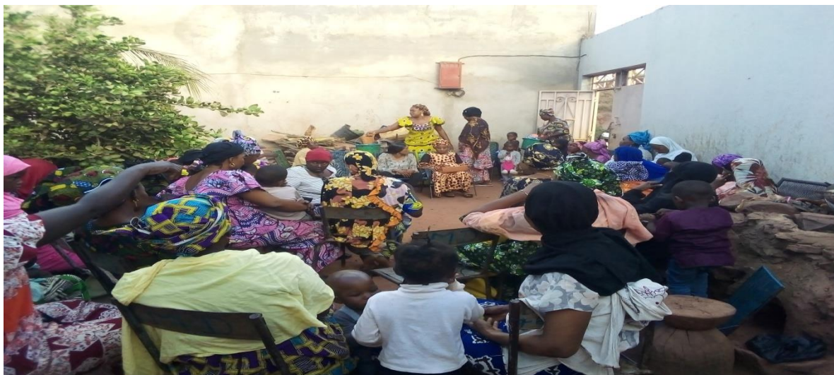
Figure 38 : Causerie éducative à l'endroit des femmes et des jeunes filles de Sangarebougou ;