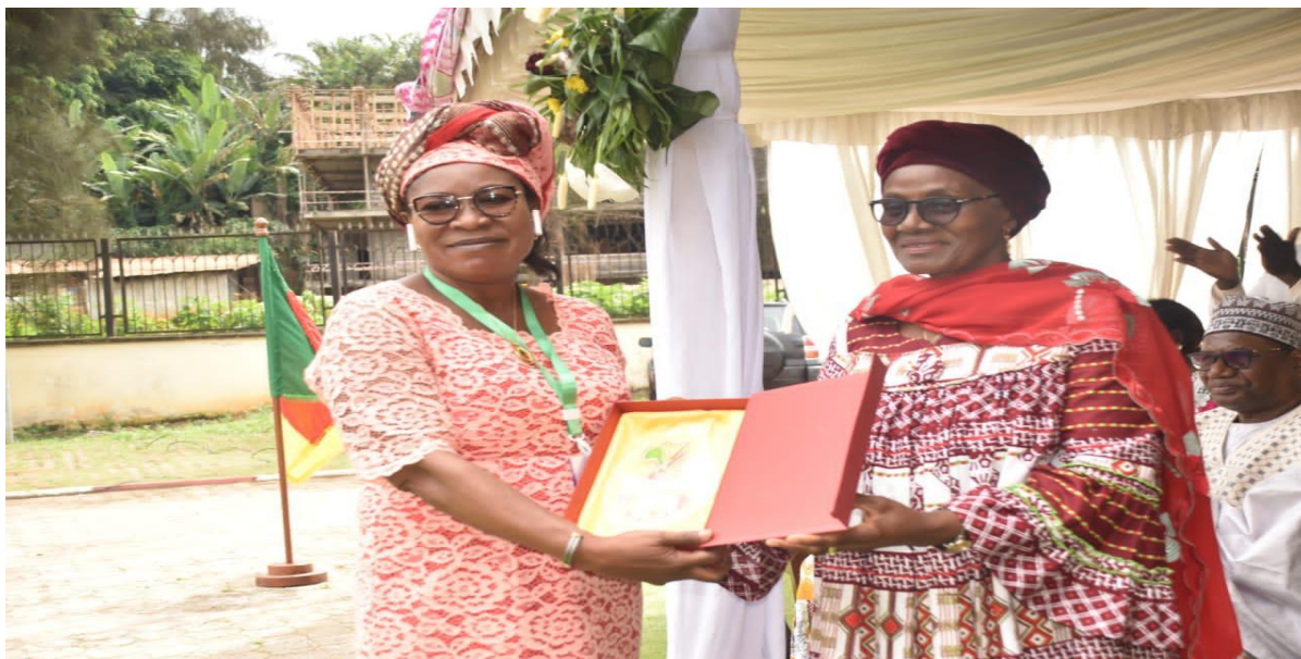
Figure 13 : La responsable chargée de la promotion de la femme, de l'enfant et de la famille au Cameroun a participé au forum international des femmes africaines rurales ;