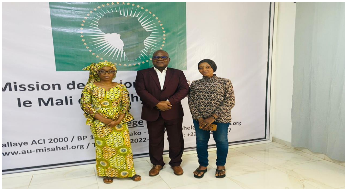
Figure 2 : Image des responsables de la Mission de l'Union Africaine pour le Mali et le Sahel (MISAHEL) et du réseau RENAJFFERM