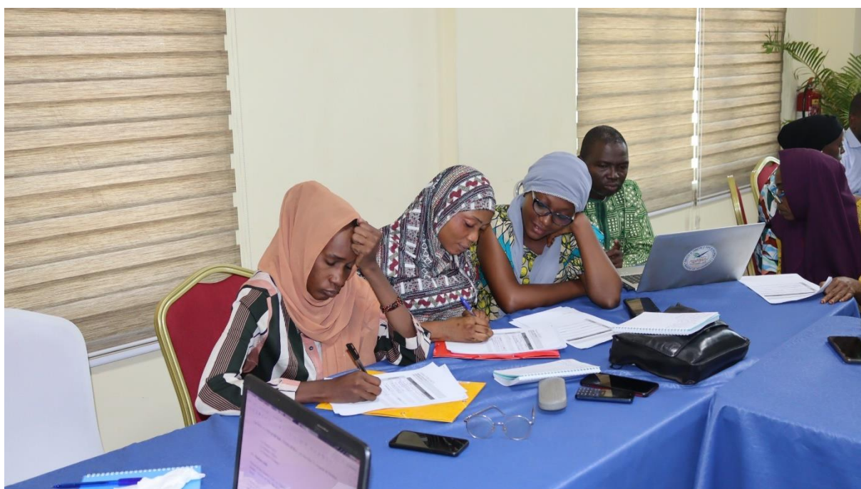
Figure 19 : Participation du RENAJFFERM à l'atelier de certification sur la passation de marché financé par l'ENAP du CANADA ;