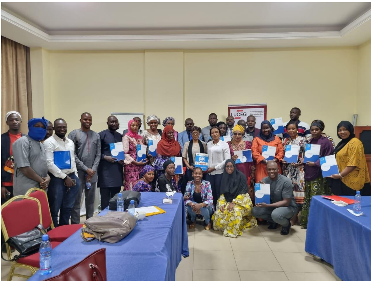
Figure 20 : Participation du RENAJFFERM à l'atelier de certification sur la Gestion stratégique de Projet financé par l'ENAP du CANADA ;