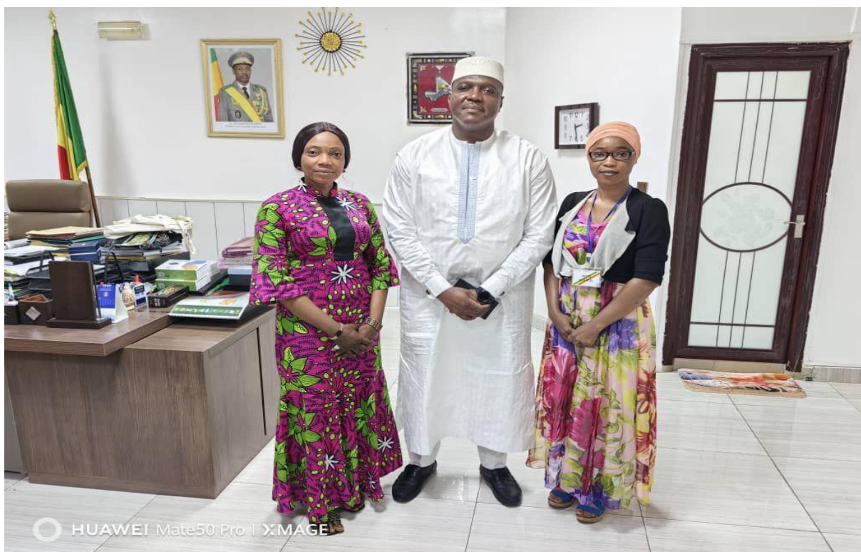
Figure 11 : Image du Ministre de l'Administration territoriale, de la décentralisation et des Collectivités locales du Mali et des responsables du réseau RENAIFFERM.