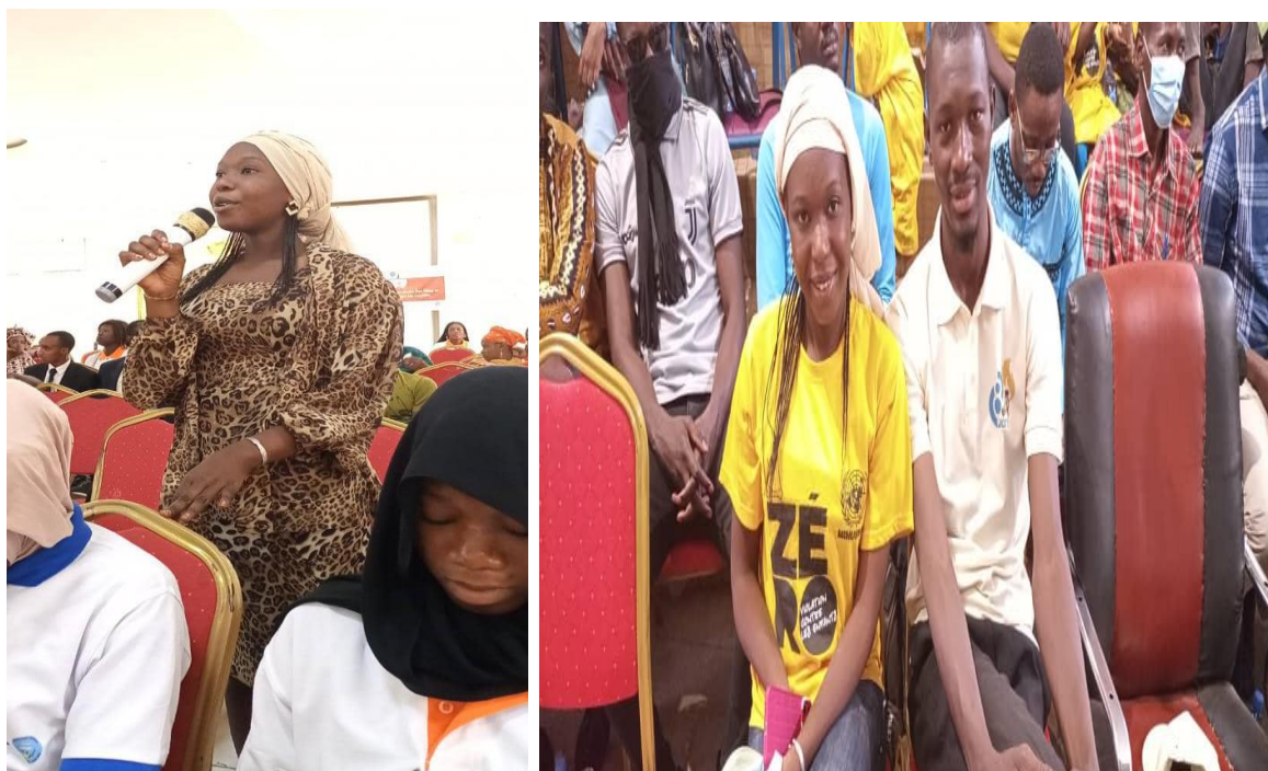
Figure 16 : Participation des membres RENAIFFERM à une conférence débat sur les VBG