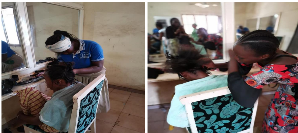
Figure 14 : Formation des membres du RENAIFFERM en coiffure