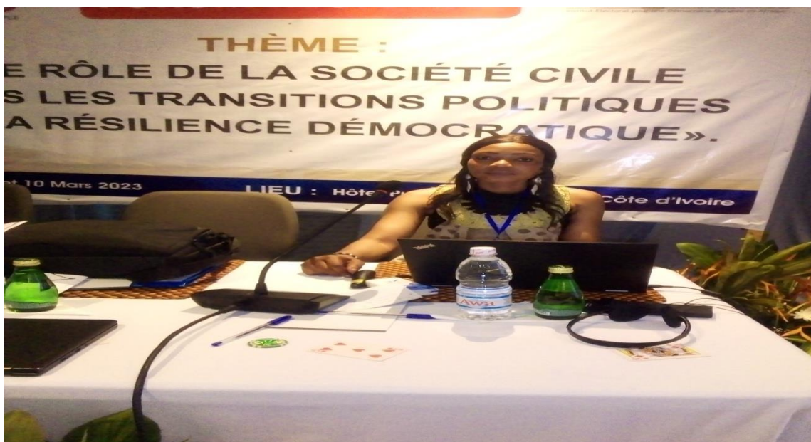
Figure 18 : Participation du RENAJFFERM au forum sur le rôle de la société civile dans les transitions politiques et la résilience démocratique ;