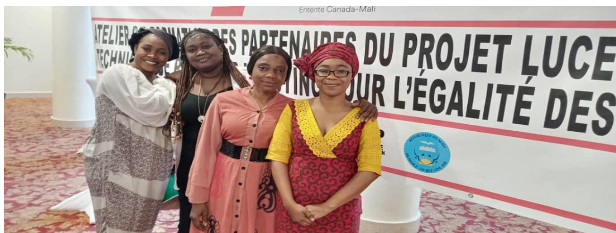
Figure 29 : Image des membres du RENAJFFERM en formation sur le genre et l'égalité des sexes.