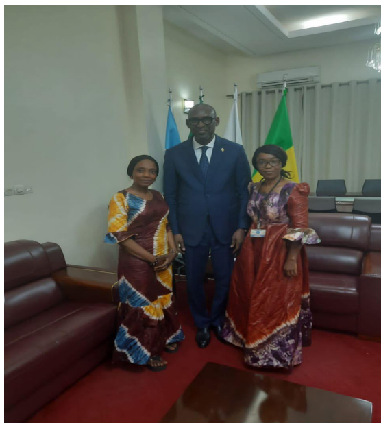
Figure 27 : Deux membres du RENAJFFERM reçus en audience par le Président du Conseil Economic Social et Culturel du Mali et le Ministre des affaires étrangères du Mali ;