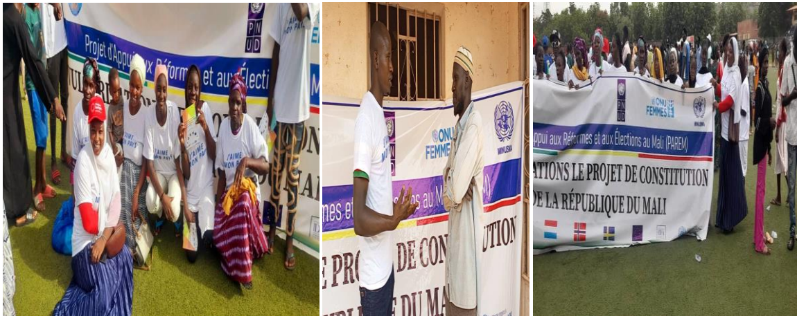
Figure 22 : Des images des Coordinations RENAIFFERM de Koulikoro, Mopti et Ségou lors du referendum ;