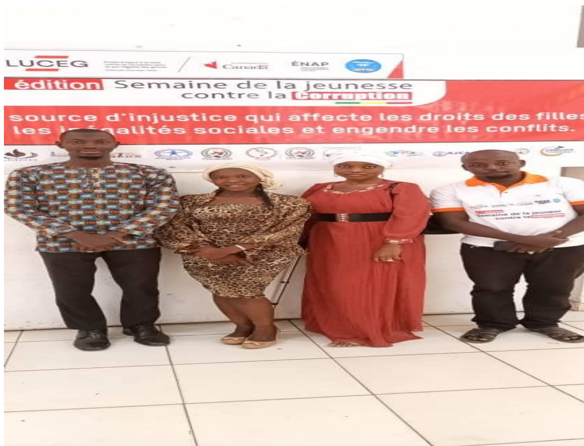
Figure 17 :Participation du Renajfferm0 la semaine de la jeunesse contre la corruption,