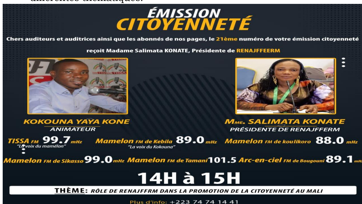
Figure 5 : La directrice Exécutive du RENAJFFERM invitée a la radio TISSA sur : « Le rôle du réseau RENAJFFERM dans la promotion de la citoyenneté au Mali » ;

enfants, le réseau a organisées plusieurs émissions radios sur ces différentes thématiques.