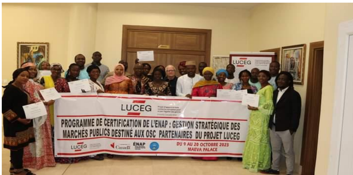
Figure 34 : Fin de la formation certifiante sur la passation de marchés public ;