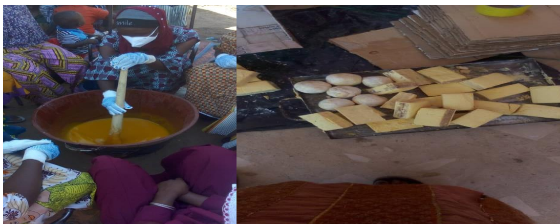
Figure 15 : Formation des membres du RENAIFFERM Sébougou en saponification