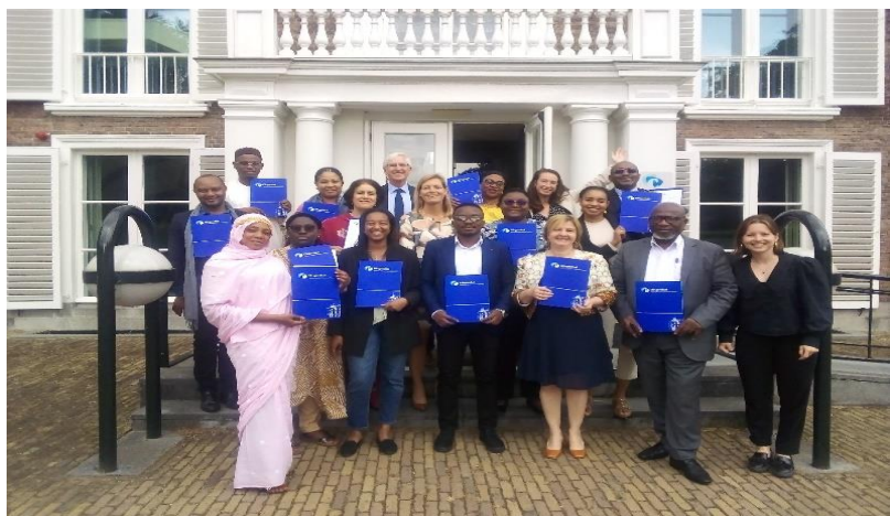
Figure 4 : La directrice Exécutive et la chargée de programme du RENAJFFERM au Pays-Bas à l'Institut Clingendael sise à la Haie à l'atelier de formation sur « La médiation et la négociation comme instrument de résolution de conflits » ;