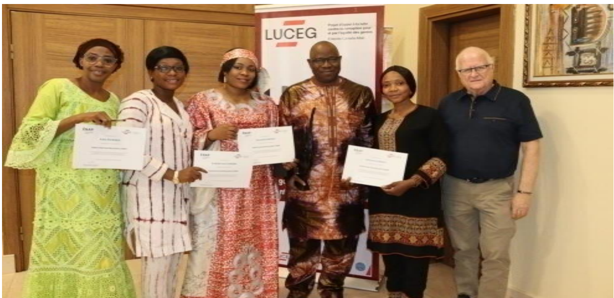
Figure 33 : Image de la remise des certificats aux membres du RENAJFFERM par le Directeur Pays du projet LUCEG