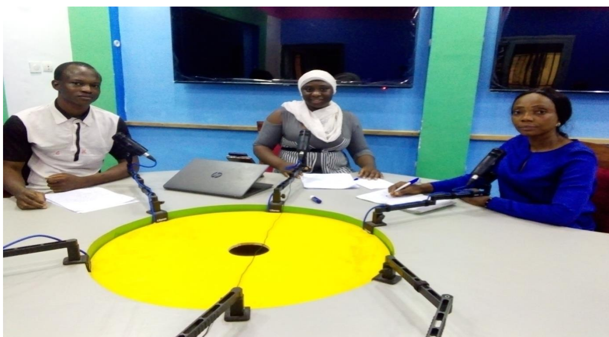
Figure 6 : La directrice Exécutive et le chargé de communication du réseau RENAJFFERM invités à la radio Baoulé sur « Le Harcèlement sexuel en milieu scolaire et en milieu de travail »