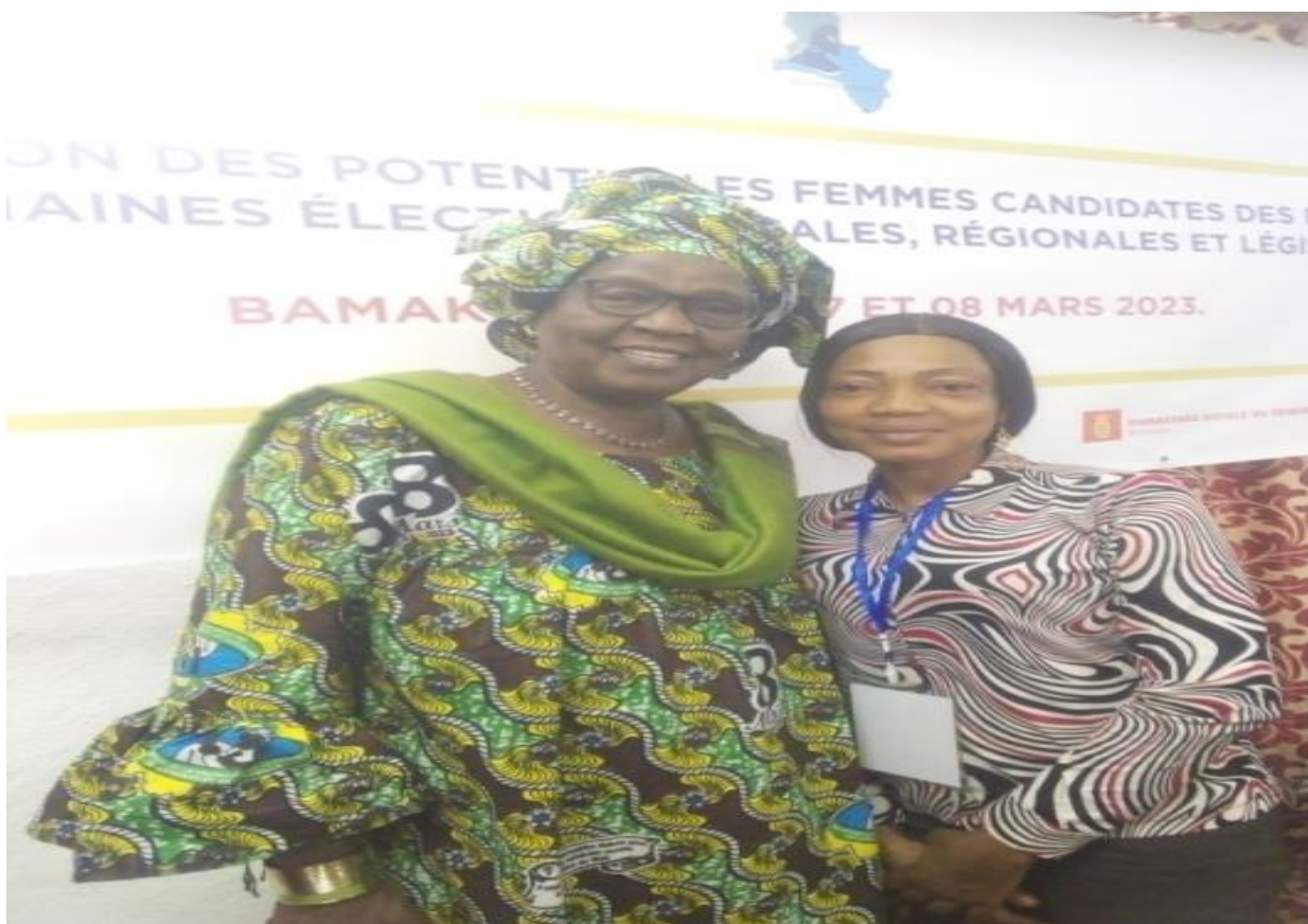
Figure 31 : La directrice RENAIFFERM avec l'ex-ministre de la promotion de la femme, de l'enfant et de la famille lors de la formation des femmes potentielles candidates lors des élections à venir ;