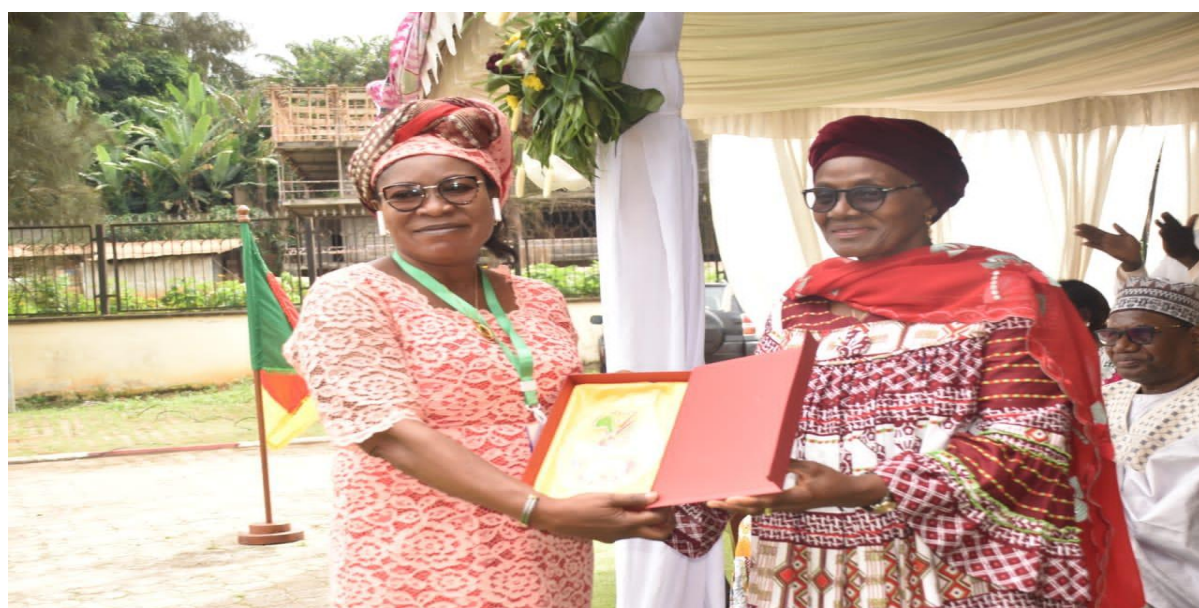
Figure 35 : Image de la chargée du Genre à Yaoundé au Cameroun pour participer à m'atelier sur :l'autonomisation des femmes rurales et le développement de l'entrepreneuriat féminin ;