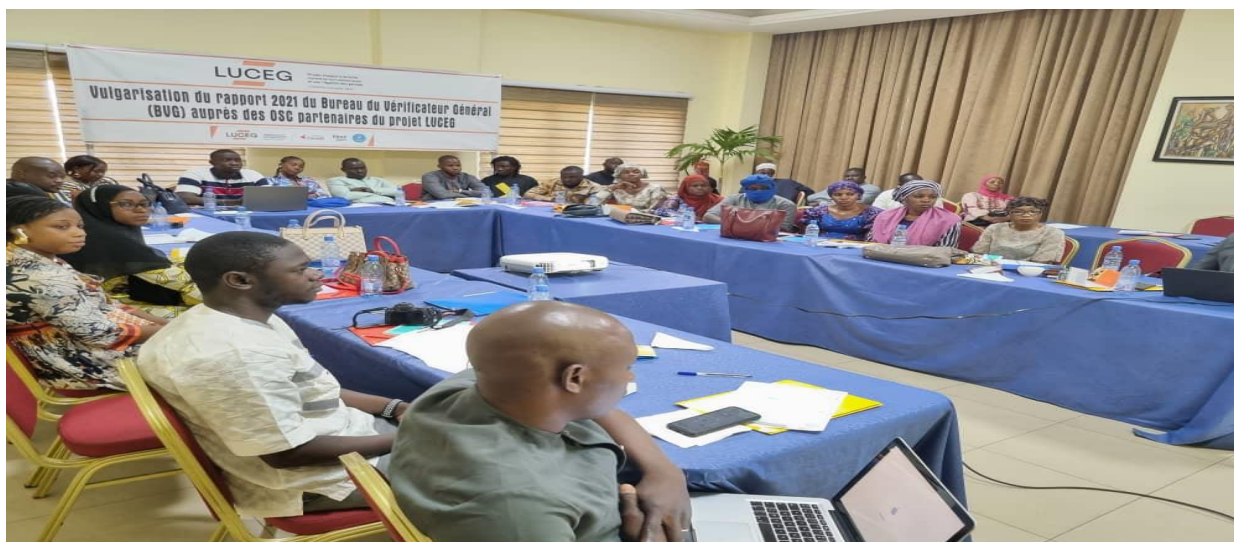
Figure 30 : Participation des membres du RENAIFFERM à l'atelier de vulgarisation du rapport du vérificateur général ;