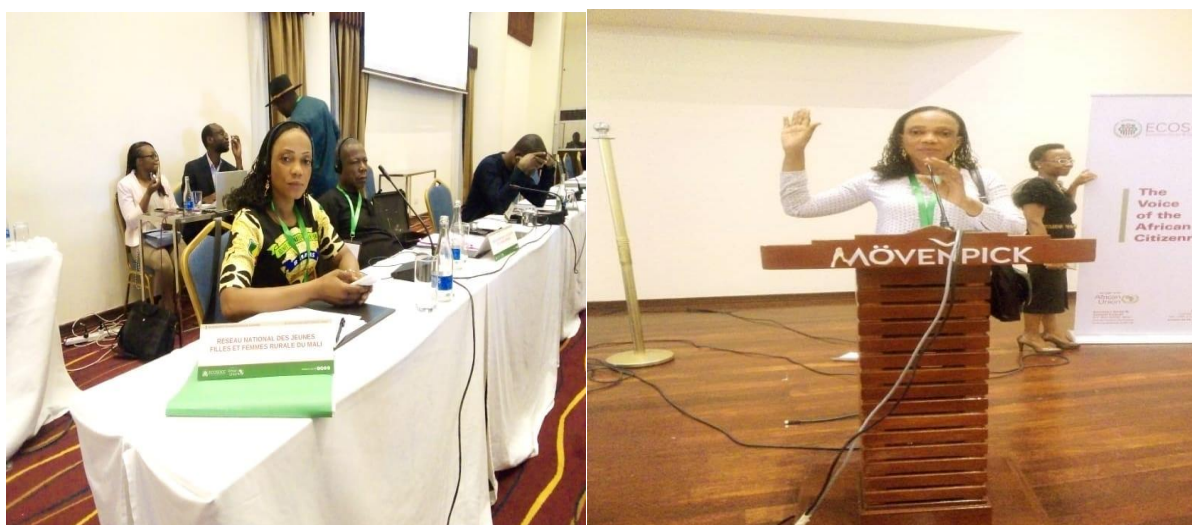
Figure 12 : La directrice Exécutive du RENAIFFERM au Kenya a participé a la 4eme assemblée générale permanente du Conseil Economic Social et Culturel (ECOSOCC) de l'Union Africaine ;