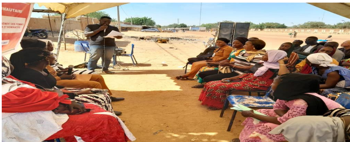
Figure 39 : Organisation du dialogue sur la représentativité et l'engagement de la femme pour les postes électoraux et nominatifs organisé par la Coordination RENAJFFERM de Ségou ;