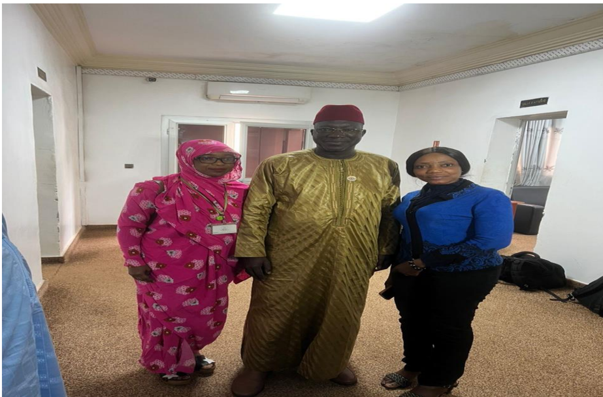
Figure 9 : Image du responsable du Conseil Economique Social et Culturel du Mali et des responsable du réseau RENAJFFERM.