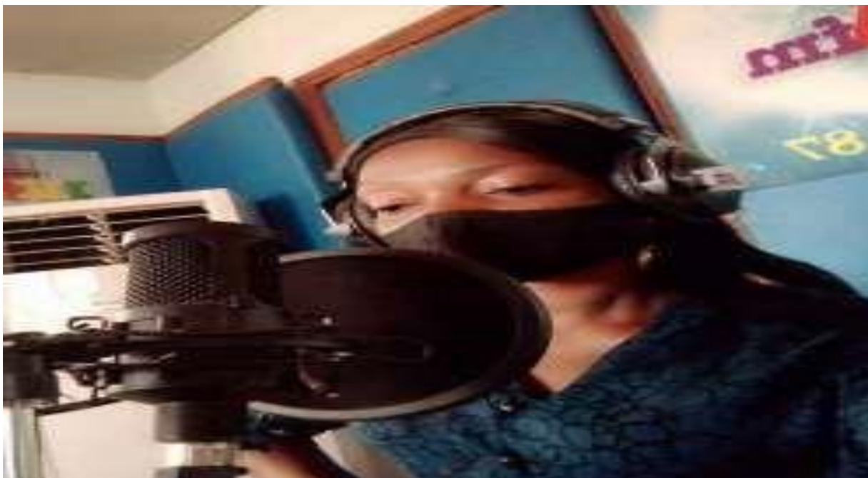
Figure 7 : La directrice Exécutive du réseau RENAJFFERM invitée à la radio IKFM sur : « Le Rôle du RENAJFFERM dans la lutte contre les VBG et l'inégalité du Genre » ;