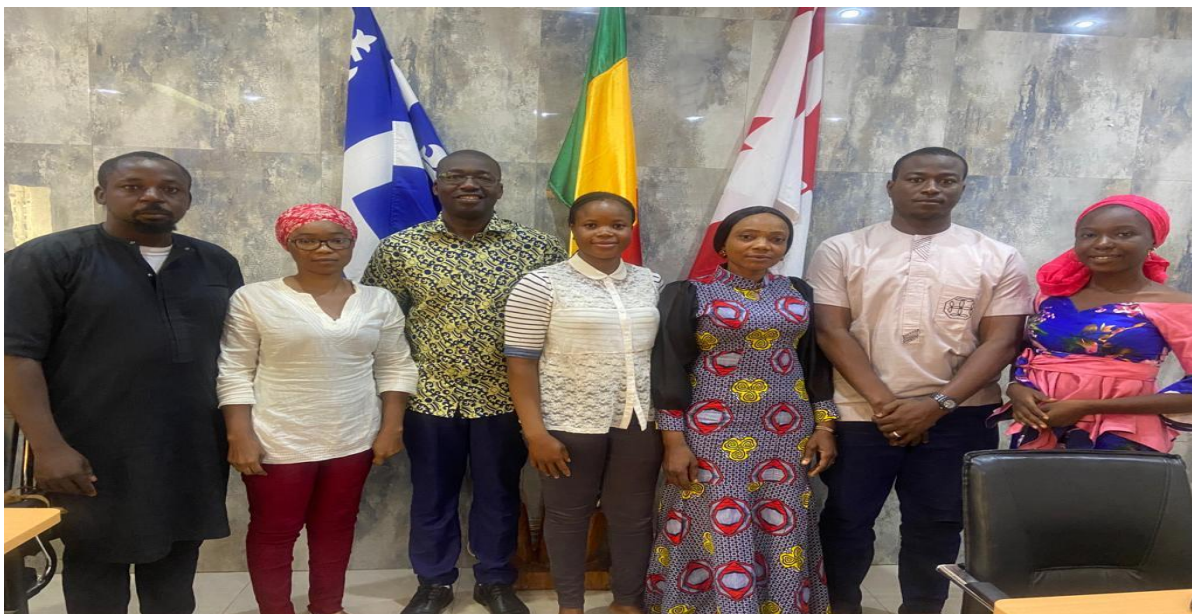
Figure 25 : Les responsables du projet LUCEG et quelques membres du RENAIFFERM ;