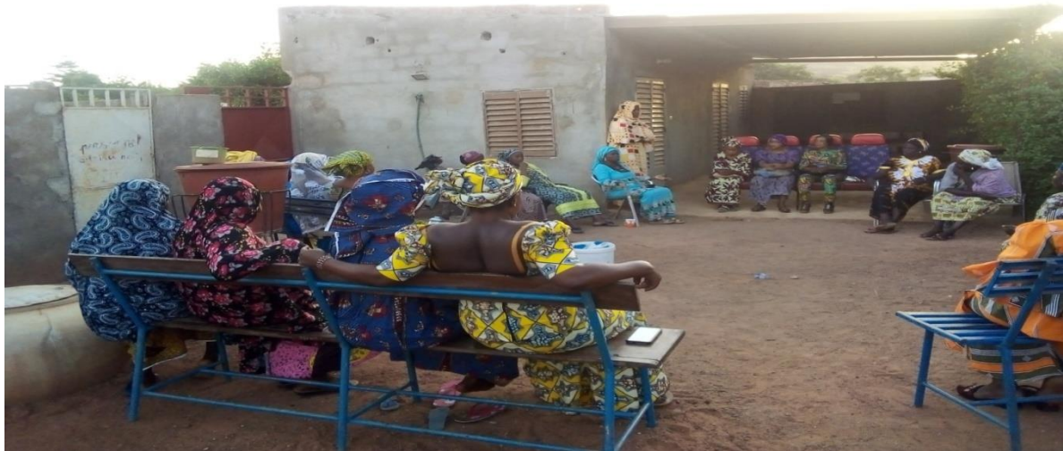
Figure 23 : Causerie éducative sur les VBG à Dougoulakoro