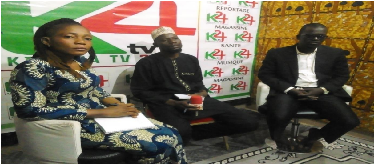
Figure 32 : Image de la responsable RENAJFFERM sur le Plateau de Web TV Kassira 24 sur la responsabilité des parents dans l'éducation des enfants ;