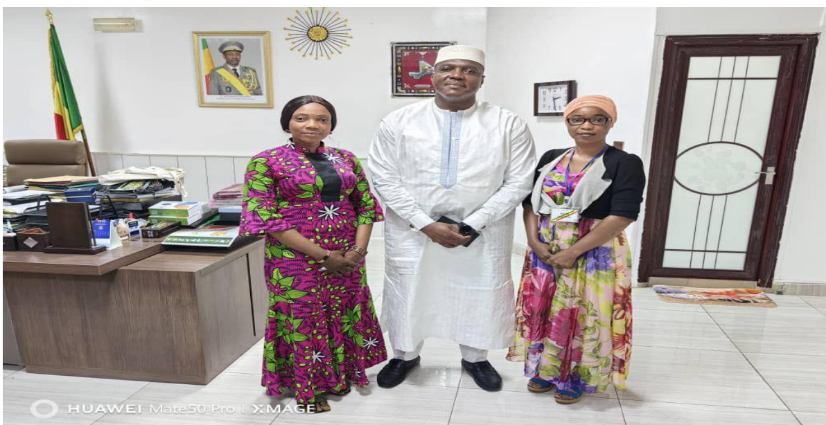
Figure 26 : Les membres du RENAIFFERM reçu en audience par le Ministre de l'administration territorial, de la décentralisation et des collectivités locales ;