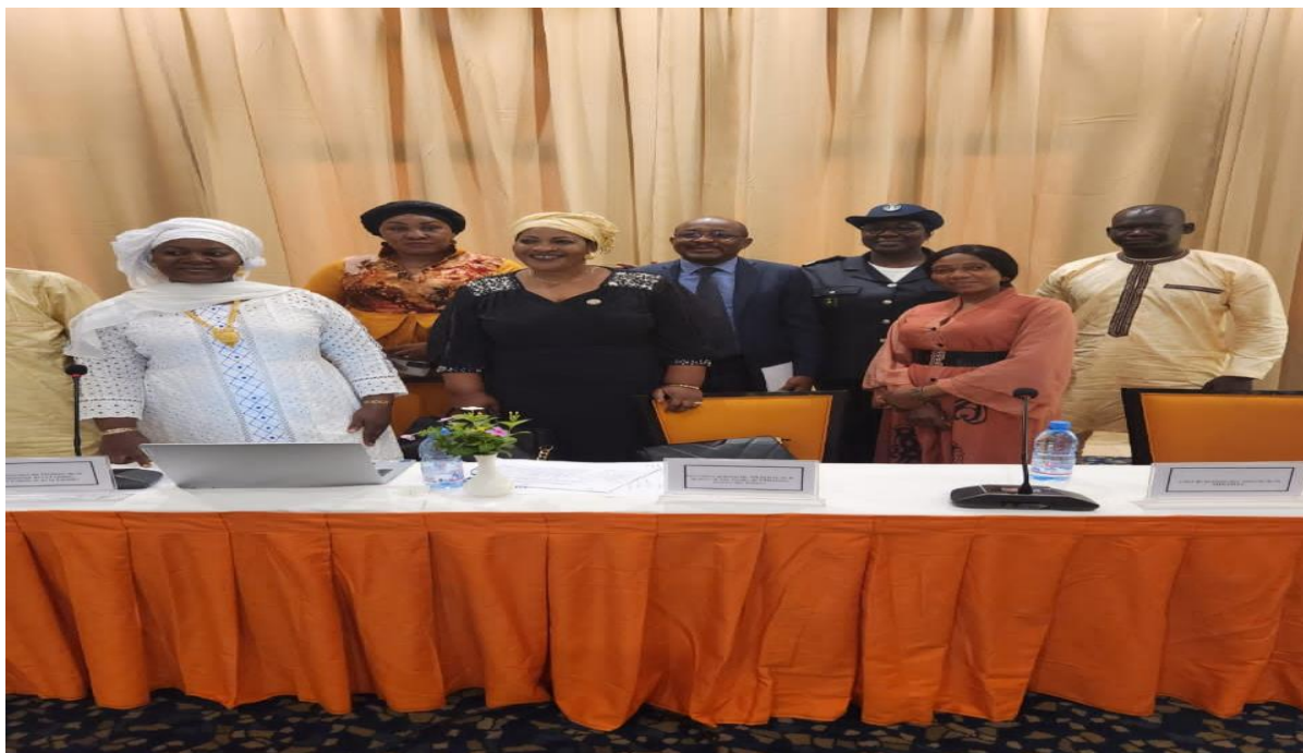
Figure 36 : Image de l'atelier d'échange organisé par la Mission de l'Union Africaine pour le Mali et le Sahel