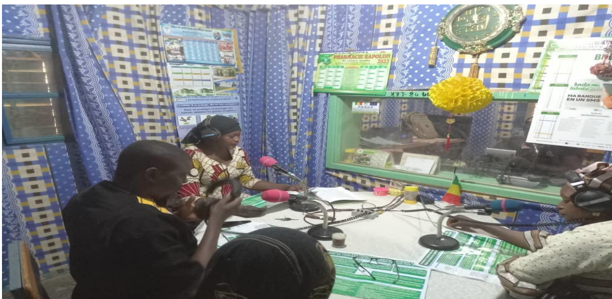
Figure 8 : Le Coordinateur régional RENAJFFERM San invitée sur « la responsabilité du réseau RENAJFFERM dans la lutte contre les VBG et l'autonomisation économique des femmes et des jeunes filles »