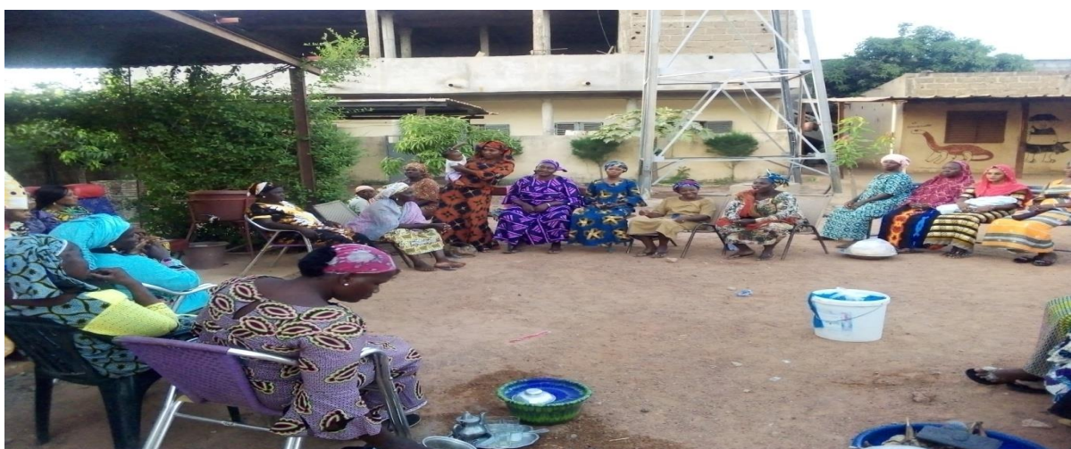
Figure 24 : Causerie éducative à l'endroit des femmes de Bakorobabougou sur les VBG et l'entrepreneuriat féminin.