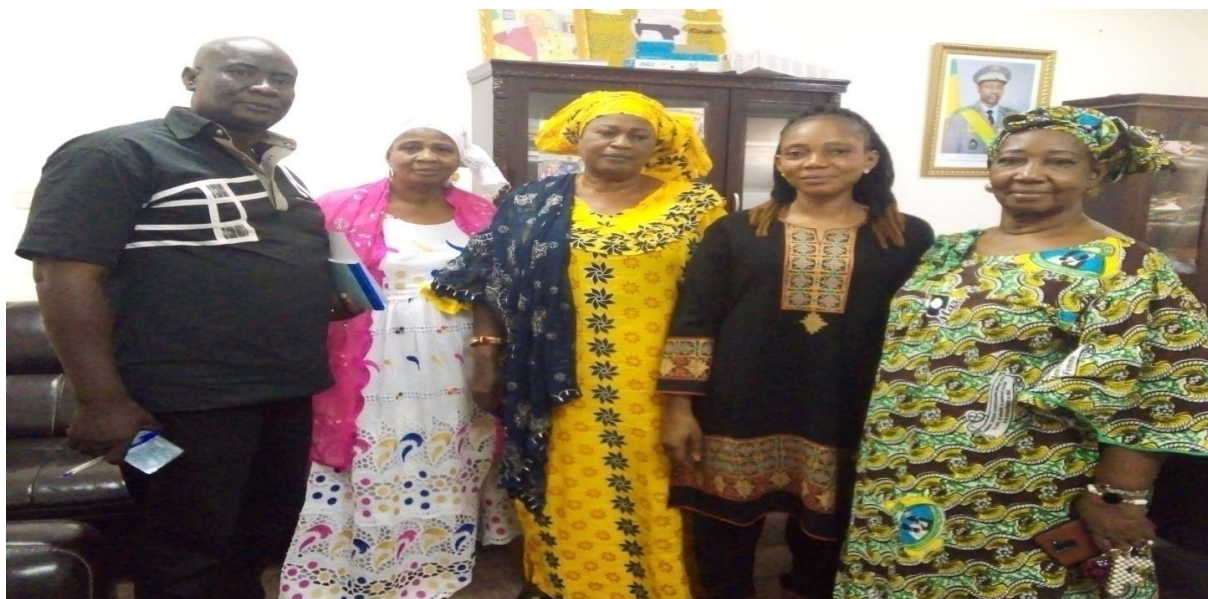
Figure 1 : Image des responsables de la maison de la femme rive gauche et du réseau RENAJFFERM lors de la rencontre de partenariat

Des rencontres ont aussi eu lieu avec des structures non étatiques telles que :