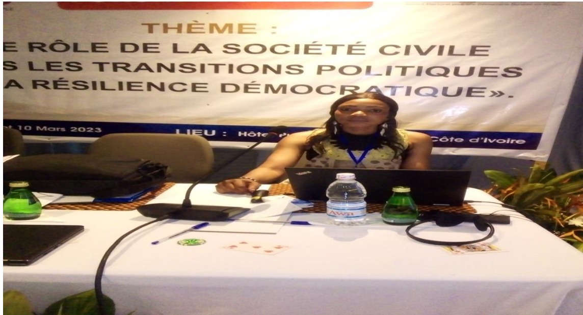
Figure 3 : Photo de la directrice Exécutive du RENAJFFERM au forum régional d'Abidjan sur les « Le rôle de la société civile dans les transitions politiques et la résilience démocratique » ;

Les membres du réseau ont participé à des formations à l'extérieur du Mali : Il s'agit des ateliers et des formations :