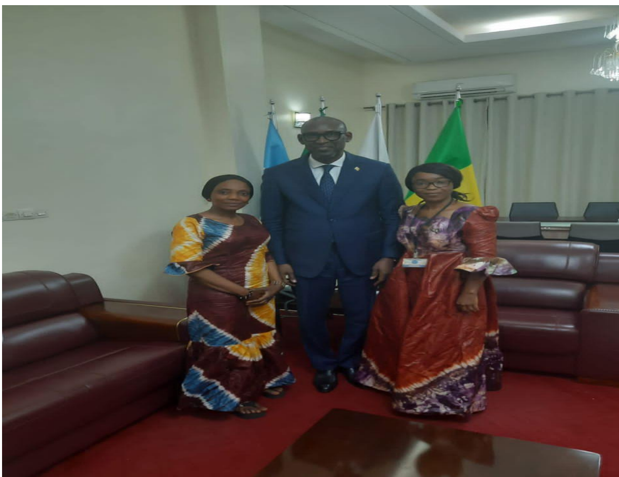
Figure 10 : Image du Ministre des affaires étrangères du Mali et des responsables du réseau RENAJFFERM.