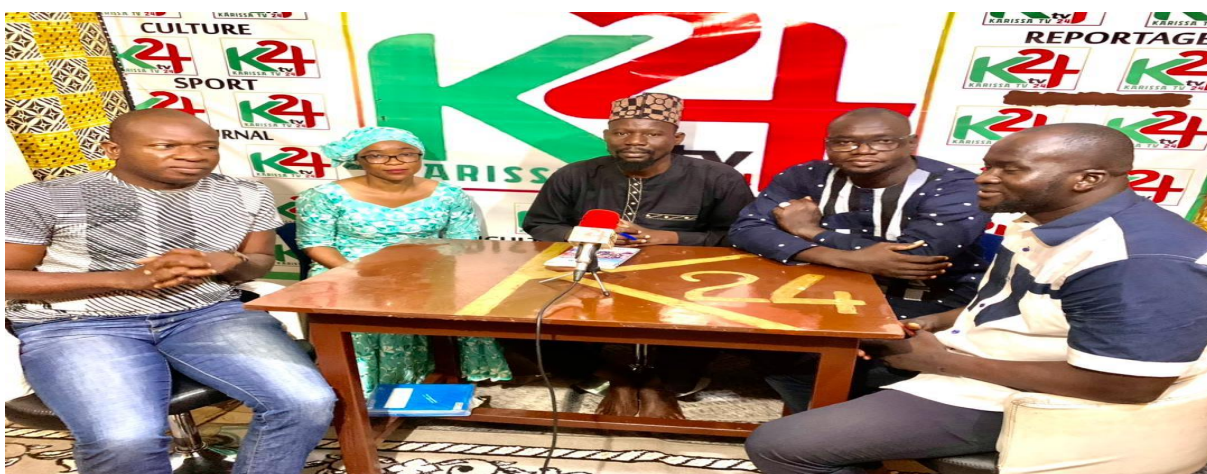
Figure 37 : Participation à l'émission plateau sur le web TV Kassira 2024 sur le thème : Rôle et responsabilité de la femme dans la société ;