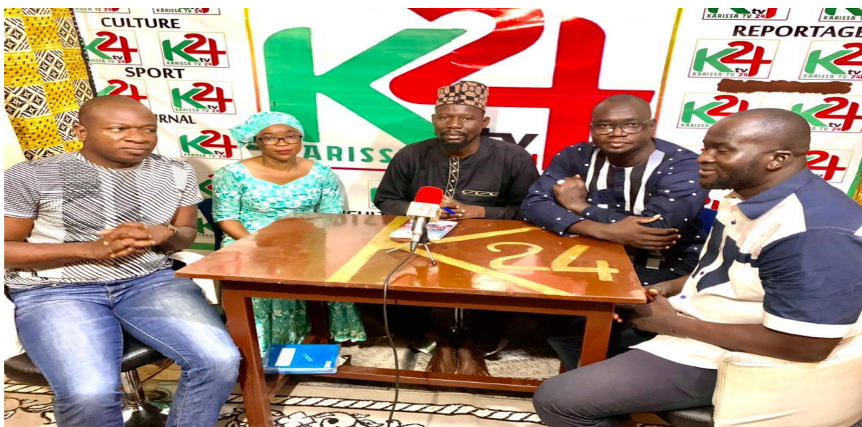
Figure : La responsable financière du réseau RENAJFFERM invitée à KASSIRA TV 24 sur « Le rôle de la jeunesse dans la lutte contre la corruption et la scolarisation des filles »